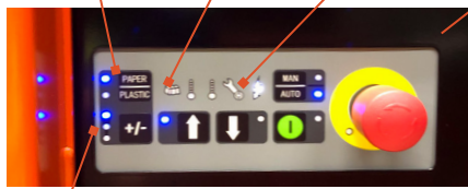
Tamaño de bala ajustable

Selector de material para cartón y plástico Indicador de bala completa Indicador de servicio