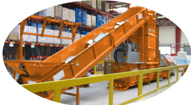
Opción: cinta alimentadora

Una solución completamente automática para la gestión de residuos y diseñada para una continua alimentación con un sistema automático de atado vertical con la posibilidad de ajustar la longitud de la bala permitiendo así una óptima producción.